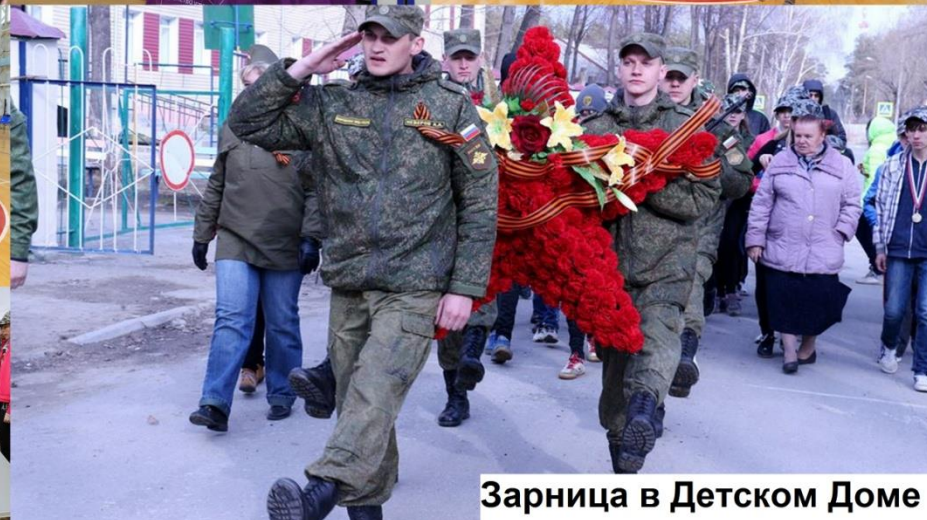
Зарница в Детском Доме