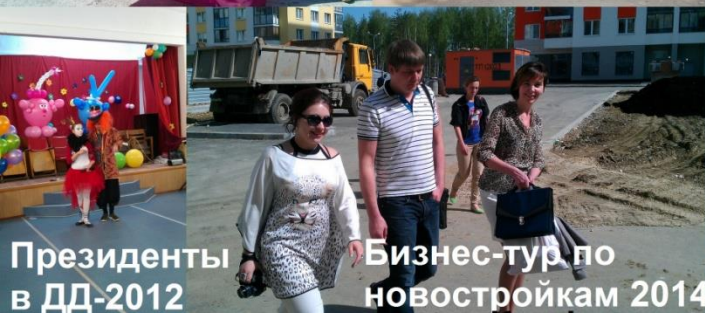
Президенты в ДД-2012