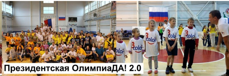
Президентская ОлимпиаДА! 2.0