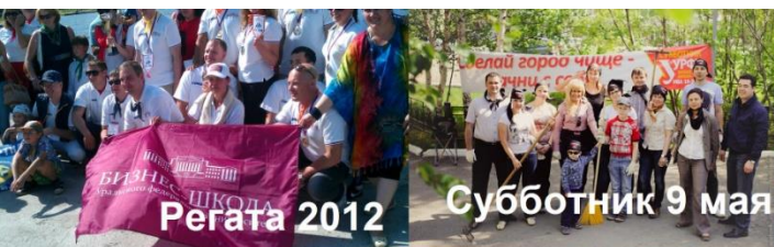
Субботник 9 мая