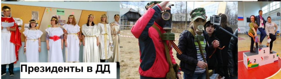
Президенты в ДД