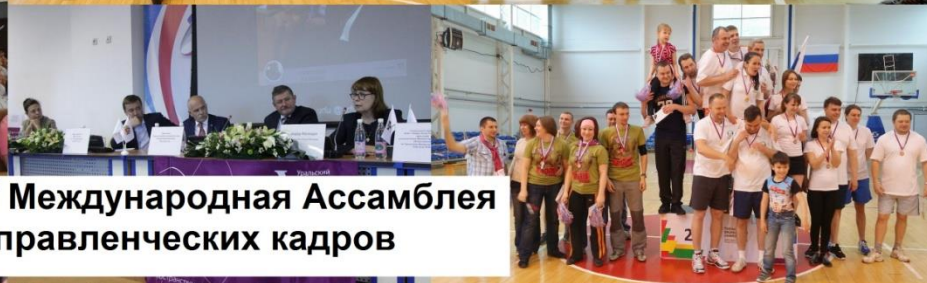
V Международная Ассамблея управленческих кадров